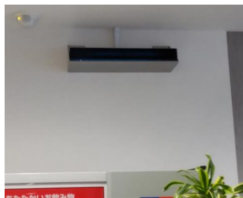
※ギャラリー内：紫外線照射装置