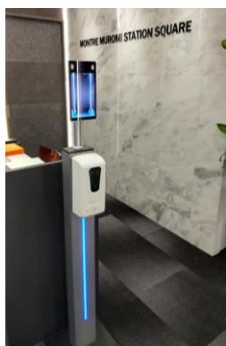
※自動消毒液噴霧器