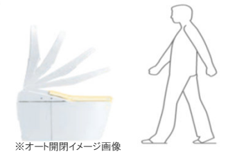
※オート開閉イメージ画像

人の動きを検知して、便ふたが自動で開閉します。閉め忘れがないので、暖房便座の保温性が高まり、節電にも効果的です。リモコン操作で便座・便ふた開閉をすることもできます。